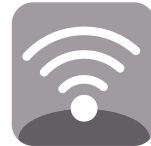
TELECOMUNICACIONES Y REDES